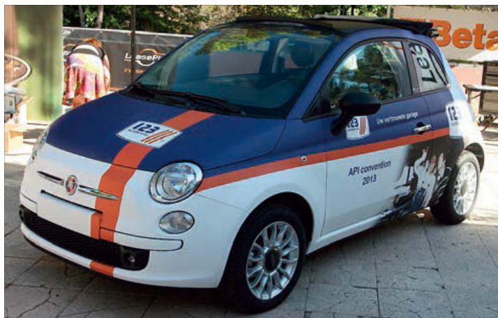
Une édition spéciale de la voiture de promotion/remplacement 1,2,3 AutoService était également présente au salon à Opio en Provence