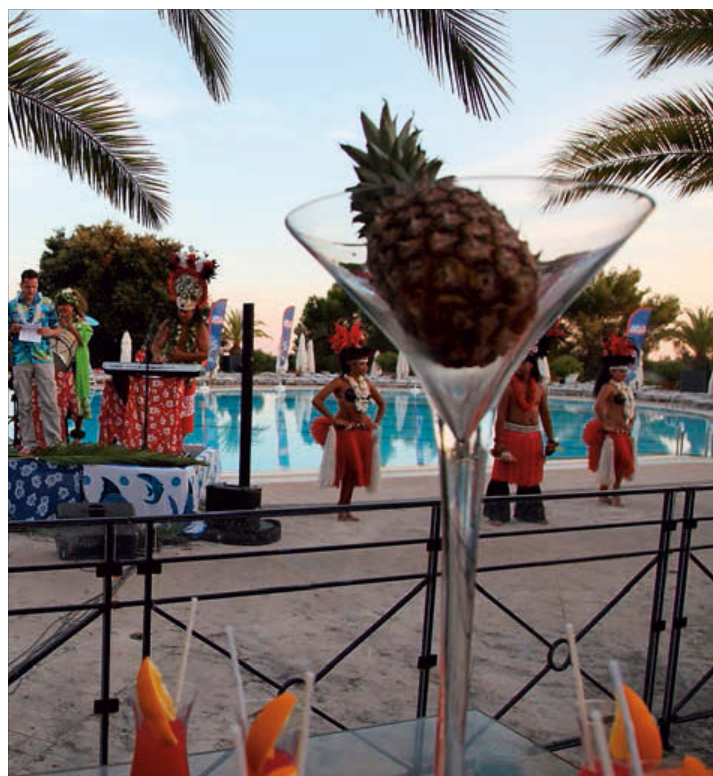
La première et la dernière soirée de la convention API en Provence ont été l'occasion de soirées à thème très colorées