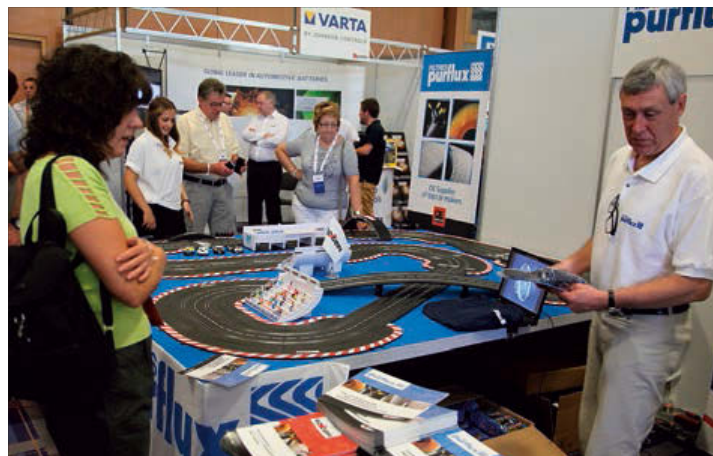
33 exposants étaient présents sur les 1.000 m 2 de surface d'exposition pendant la convention API dans le sud de la France