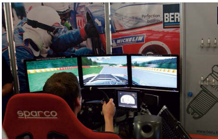
Le salon a été conçu de la manière la plus interactive possible avec notamment des simulateurs de courses et des démonstrations